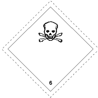
Rótulo Peligro Principal